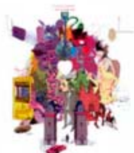
Gate All Done - Will Norris